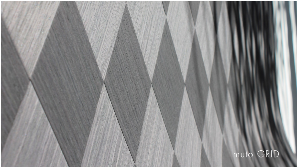
muto GRID dark slope