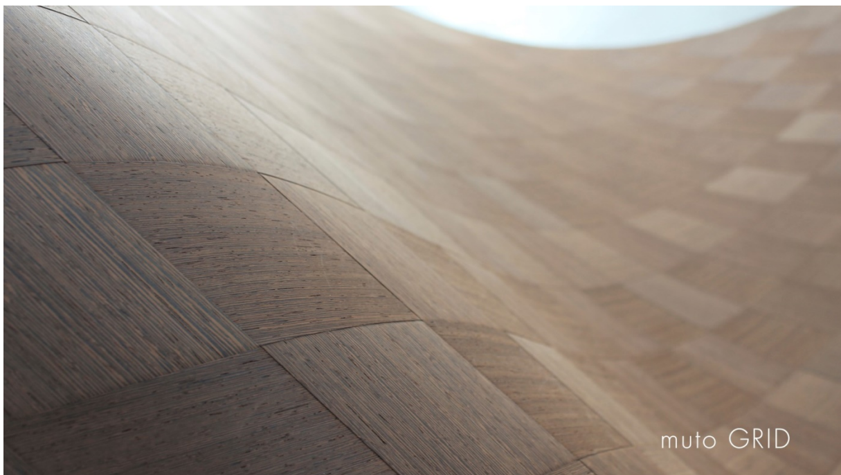
muto GRID light slope

Neben den fünf verfügbaren Designs sind individuelle Varianten nach Kundenwunsch möglich (muto GRID exclusive). Hier sind der Fantasie kaum Grenzen gesetzt: Mehr als 100 Holzarten lassen sich flexibel kombinieren. Viele Muster, die aus der Weberei bekannt sind, können realisiert werden. Die einzige Bedingung ist, dass die Furnierstreifen nicht schmaler als 2cm sind. Auch bei dem Format haben Sie freie Wahl – muto GRID exclusive kann bis zu einer maximalen Größe von circa 3,05 x 1,22m gefertigt werden. Die Produktionszeit beträgt je nach Komplexität des Designs und der Menge zwei bis sechs Wochen.