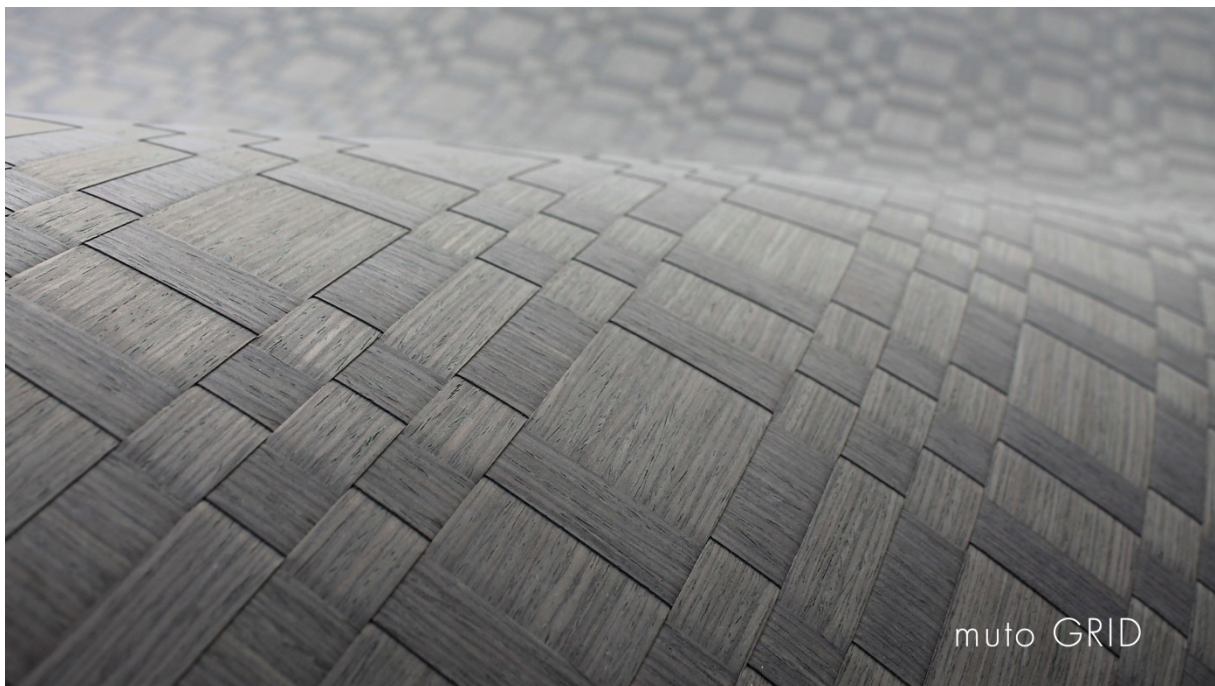
muto GRID grey horizon

Bei Schorn & Groh finden Sie auch weitere spannende vlieskaschierte Produkte, die unter dem Namen „fleece’n’flex PLUS“ bekannt sind, darunter Furniere mit strukturierter Oberfläche, mit HPL-Rückseite, mit perforierter Oberfläche, mit melaminbeschichteter Oberfläche und extra dünn geschliffen zum Hinterleuchten. Mit der geflochtenen Variante muto GRID baut Schorn & Groh sein umfangreiches Produktportfolio und seine Innovationsführerschaft weiter aus.